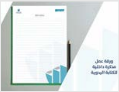
ورقة عمل مذكورة دائرية للكاتبة اليدوية