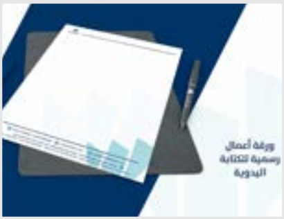
ورقة أعمال رسمية للكتابة اليدوية