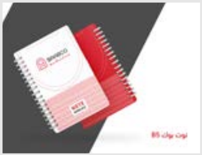
نوت بوك B5