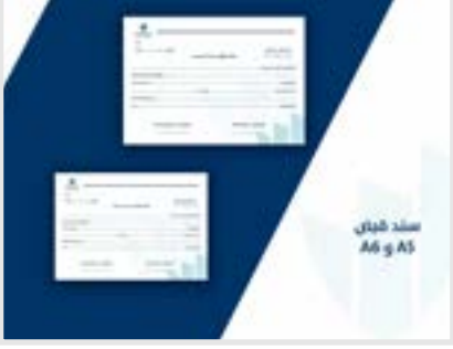
سند كتابي A6 و A5