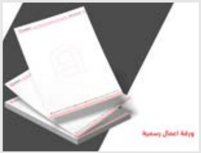
ورقة عمل رسمية