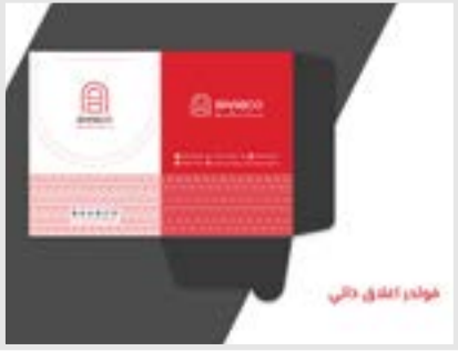
فولدر الخارقي دالي