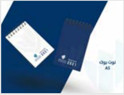
نوت بوك A5